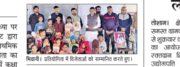
भिवानी। प्रतियोगिता में विजेताओं को सम्मानित करते हुए।