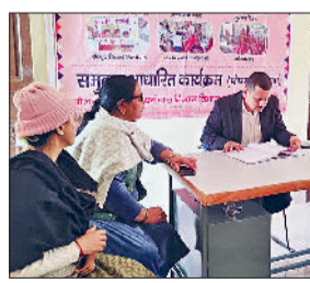
बाढ़ड़ा। आंगनबाड़ी के रिकार्ड की जांच करते हुए।

बाढ़ड़ा। उपमंडल बाढ़ड़ा के एसडीएम आशीष सांगवान ने आज क्षेत्र के आंगनबाड़ी केंद्रों व स्कूलों का औचक निरीक्षण किया। निरीक्षण के दौरान उन्होंने बच्चों से सीधे संवाद कर उनकी पढ़ाई, पोषण और सुविधाओं के बारे में जानकारी ली। एसडीएम ने स्कूलों व आंगनबाड़ी केंद्रों में मूलभूत सुविधाओं का जायजा लेते हुए साफ-सफाई, शौचालयों की स्थिति और पेयजल व्यवस्था पर विशेष ध्यान दिया। निरीक्षण के दौरान कुछ स्थानों पर पाई गई कमियों को लेकर उन्होंने खंड शिक्षा अधिकारी को आवश्यक दिशा-निर्देश जारी किए। एसडीएम आशीष सांगवान ने स्पष्ट निर्देश दिए कि सभी स्कूलों में शौचालयों को नियमित रूप से चालू रखा जाए तथा बच्चों के लिए स्वच्छ पेयजल की उचित व्यवस्था सुनिश्चित की जाए। उन्होंने कहा कि बच्चों के स्वास्थ्य व स्वच्छता से किसी भी प्रकार का समझौता नहीं किया जाएगा। निरीक्षण के दौरान संबंधित अधिकारियों को समझबूझ रूप से सूचारु कार्य पूरा करने के निर्देश भी दिए गए। उन्होंने खंड शिक्षा अधिकारियों को आदेशित कि स्कूलों में साफ सफाई का विशेष ध्यान रखा जाए ताकि आगे से कोई शिकायत या खामी ना मिले।