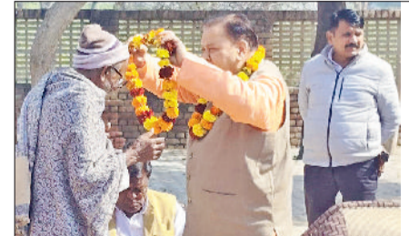
भिवानी। वीबीजी राम जी के तहत आयोजित कार्यक्रम में एक बुजुर्ग को माला पहनाकर सम्मानित करते विधायक