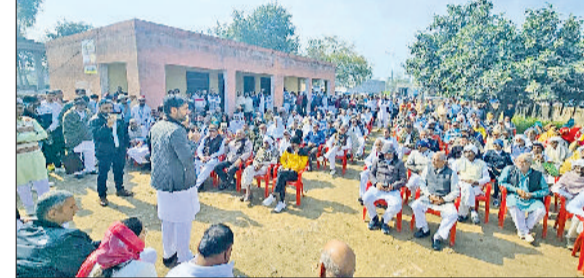
हरिभूमि न्यूज ►► तोशाम

इसके पश्चात उन्होंने कैरू के खंड विकास एवं पंचायत अधिकारी कार्यालय के बाहर भी मनरेगा बचाओ संग्राम के तहत सांकेतिक धरना-प्रदर्शन किया। उल्लेखनीय है कि कांग्रेस के ग्रामीण जिला अध्यक्ष