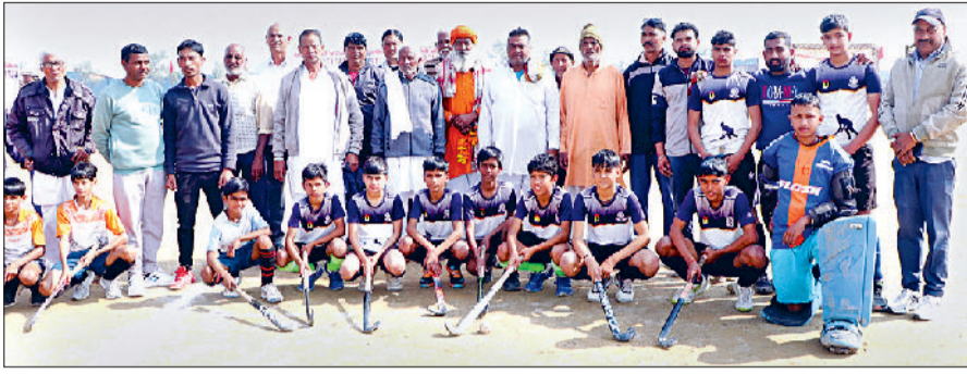
भिवानी। मैच शुरू होने से पहले खेल मैदान में टीम।